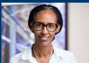
אמירה אמרה חברה